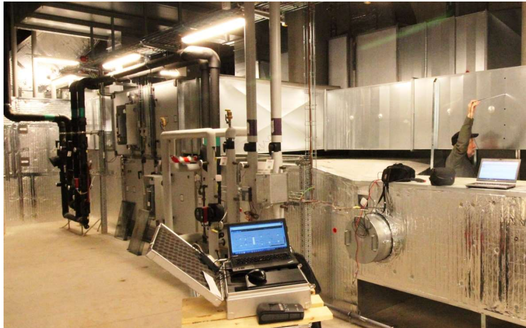
Illustration nr. 3 herover og 4 herunder. Foto fra igangvære performancetest, hvor der udføres stikprøvekontrol mht sammenhæng mellem anlægsopbygning, anlægsbillede, instrumentering, følernøjagtighed og logninger.