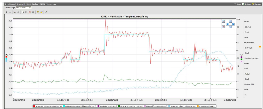
Illustration nr. 3. Skærmbillede fra visninger af logninger på CTS brugerflade.